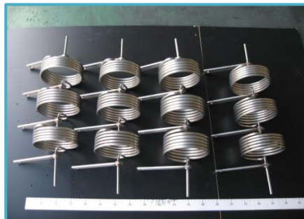
インコネル600 ヒーターコイル