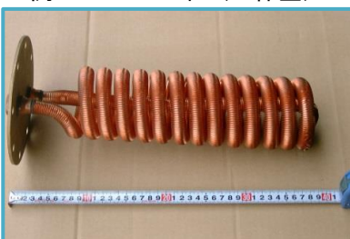
転造フィンチューブコイル