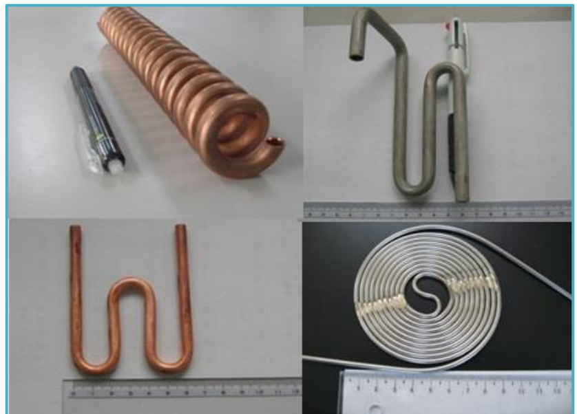
最小径φ1.5～ 肉厚0.25～ 多様な形状に対応