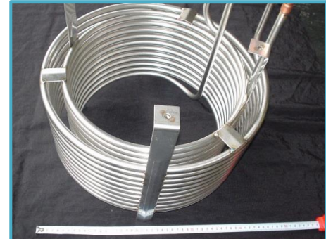
SUS304 6m×4本溶接 巻径φ410