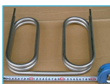
SUS316 セミシームレス2重管