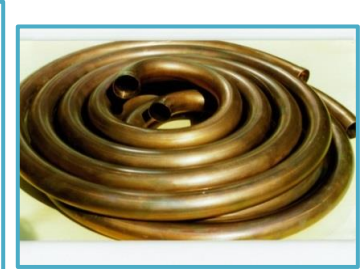
銅 渦巻き型 φ34