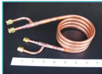
銅2重管 ロー付け加工品