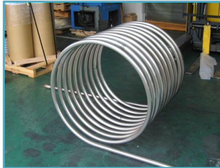
インコネル600 φ34×t3 外径φ800