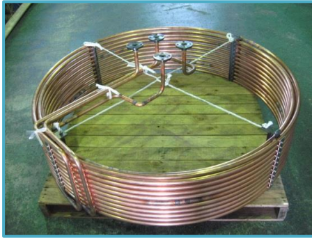
銅 φ19.05 外径φ1300