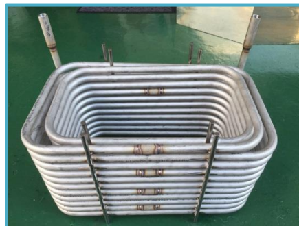
ステンレス 四角管曲げコイル