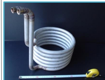
SUS304 コンパクトな曲げ