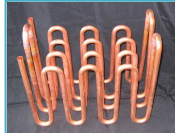
連続ヘアピン×4段重ね