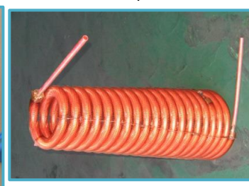
テーパー形状コイル