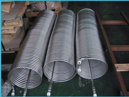
ステンレス 巻径φ250×コイル長1m