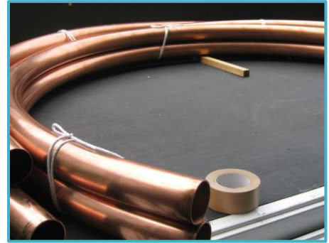
銅 φ79.38 1800R・2100R